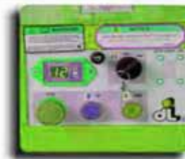
Ground Control With Outrigger LEDs