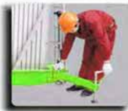
Swing Out Outrigger With Interlock