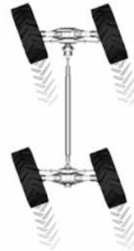
Dirección en cangrejo para los acercamientos laterales y las maniobras delicadas