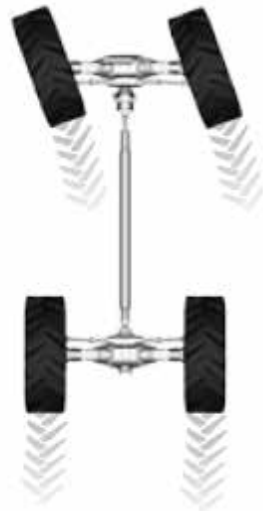
2 ruedas anteriores directrices para garantizar la seguridad en carreteras