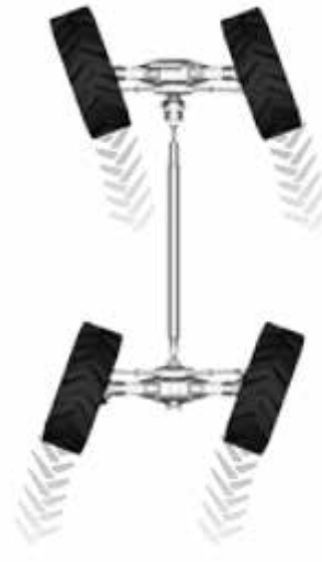
4 ruedas dirigibles para maniobras con poco espacio